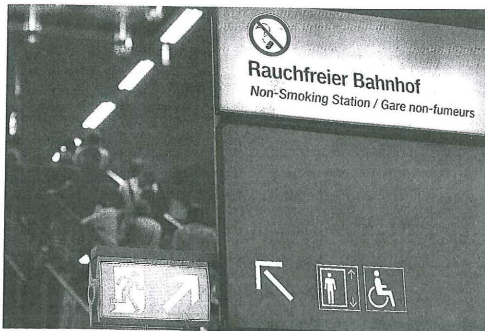
Vielsprachigkeit: Auch am Hauptbahnhof ein Thema