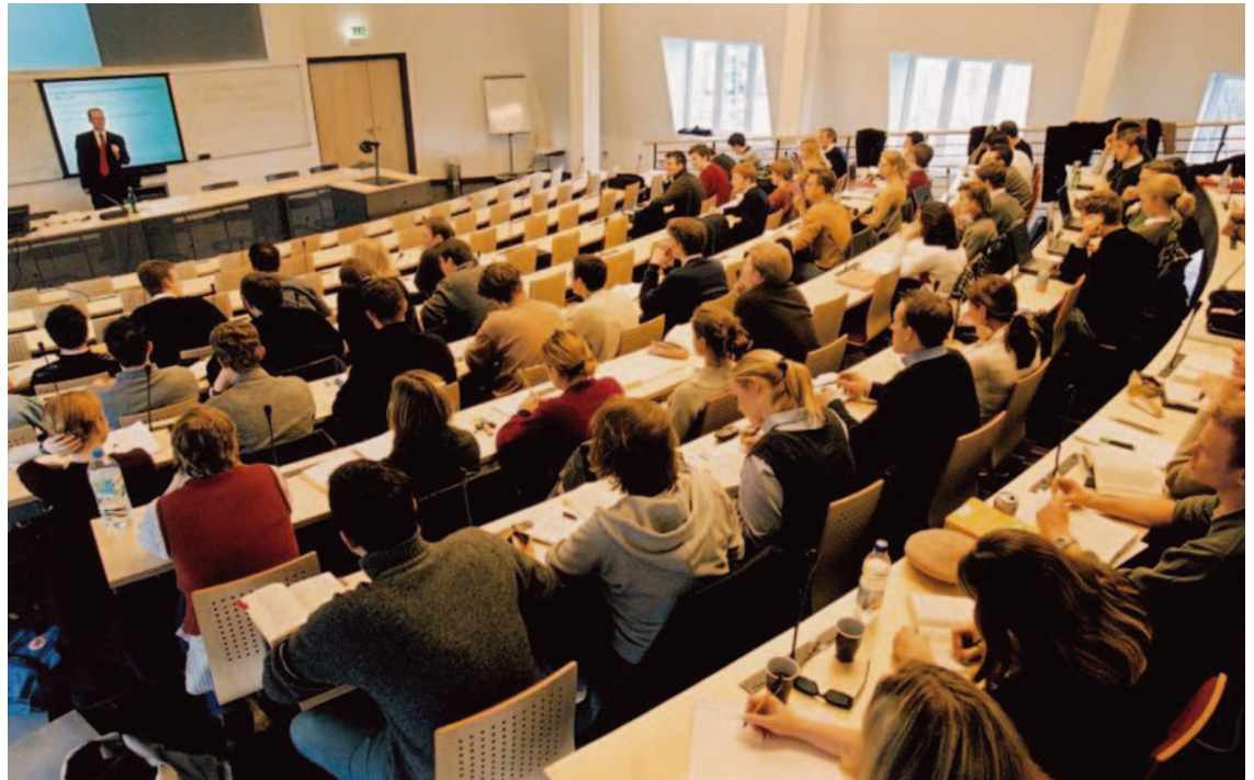
Vorlesung im Nixdorf-Hörsaal an der Bucerius Law School – der ersten privaten Hochschule für Rechtswissenschaften in Deutschland

In keiner anderen Stadt gibt es ein so breites Bildungsangebot, wie in der Metropolregion Hamburg. Ob Schule, Berufsausbildung oder Weiterbildung – in unserer Stadt gibt es kaum ein Fach, einen Beruf, den man nicht erlernen kann. In den letzten Jahren haben sich auch immer mehr Privatschulen etabliert.