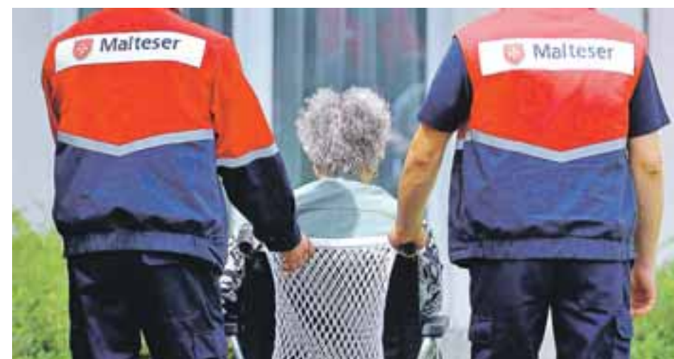
Zivis betreuen eine Dialysepatientin.

davon stationär: 11029 davon ambulant: 11529