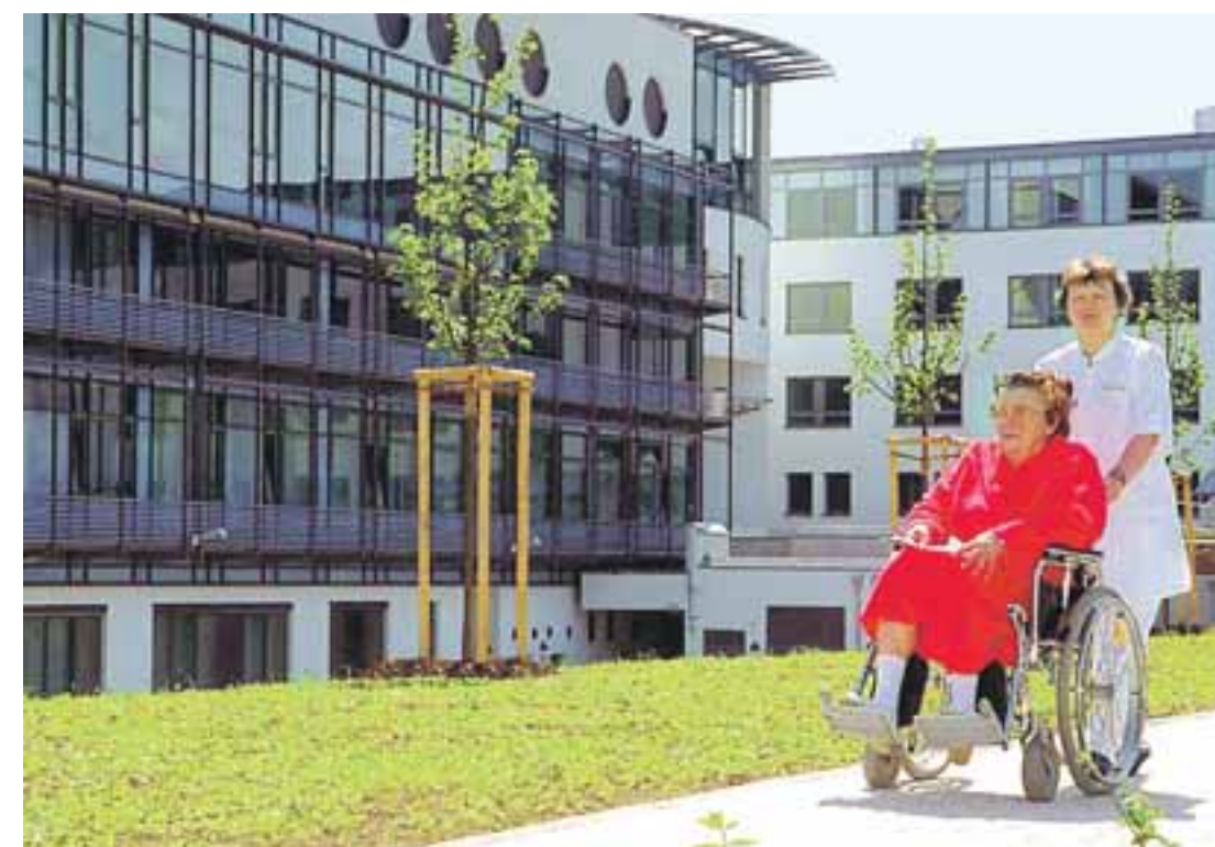
Die Gesellschaft altert - Lösungen zur Finanzierung der Pflege stehen noch aus.

Erst kürzlich veröffentlichte das Wifor-Institut eine Studie mit dem Titel „Die Pflegebranche als Wachstums- und Beschäftigungstreiber in Deutschland“. Das Wifor-Institut ist eine Ausgründung der Technischen Universität Darmstadt