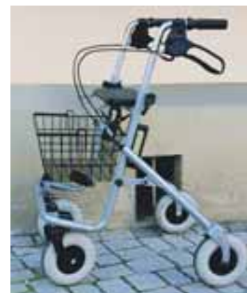
Mehr Senioren brauchen mehr Pflegekräfte.

Mit ihm habe das Land ein innovatives und vernünftiges Mittel gefunden, um kontinuierlich eine Datenbasis für den Bereich der Aus- und Fortbildung in der Pfl-