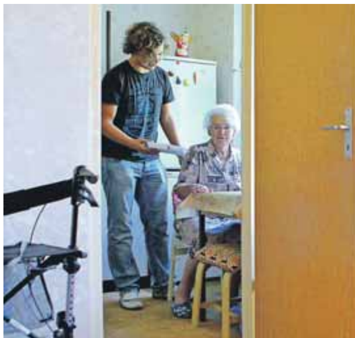
Service für zu Hause: Essen auf Rädern.