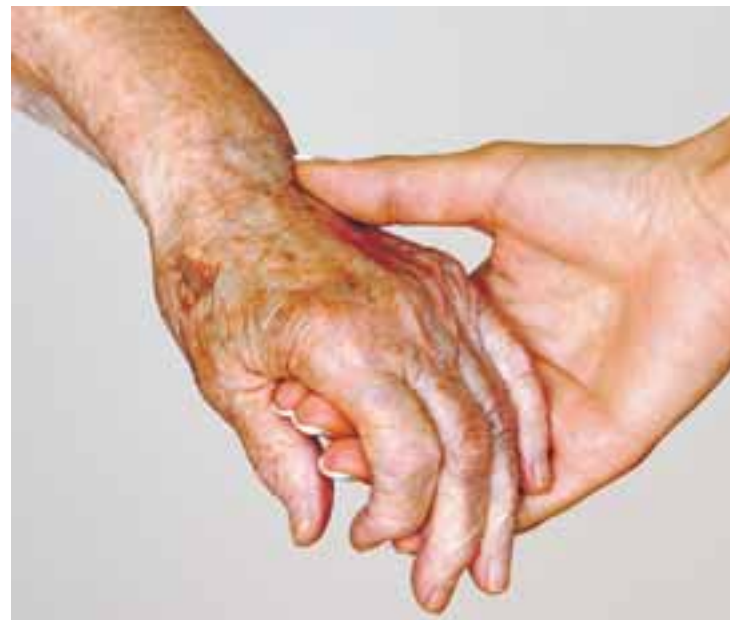
Die FH Magdeburg bietet ein Studium im Bereich Gesundheitsförderung an.