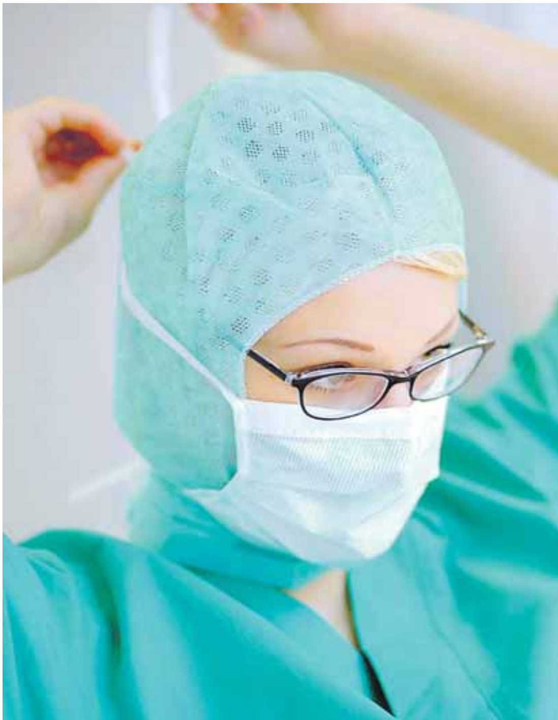
Jobmotor Gesundheitswesen: Gute Aussichten eine Anstellung zu finden, bietet der Gesundheitssektor Fachkräften in den kommenden Jahren.

Zudem sind immer mehr Menschen bereit, Ausgaben für ihre Gesundheit privat zu finanzieren. Ein weiterer Motor des Wachstums des Gesundheitswesens sind medizinisch-technische Innovationen. Fortschritte in Medizin, Medizintechnik und Pharmazie, die neue Diagnose- und Therapieformen ermöglichen. Qualifizierte Fachkräfte der Sozial- und Ge-