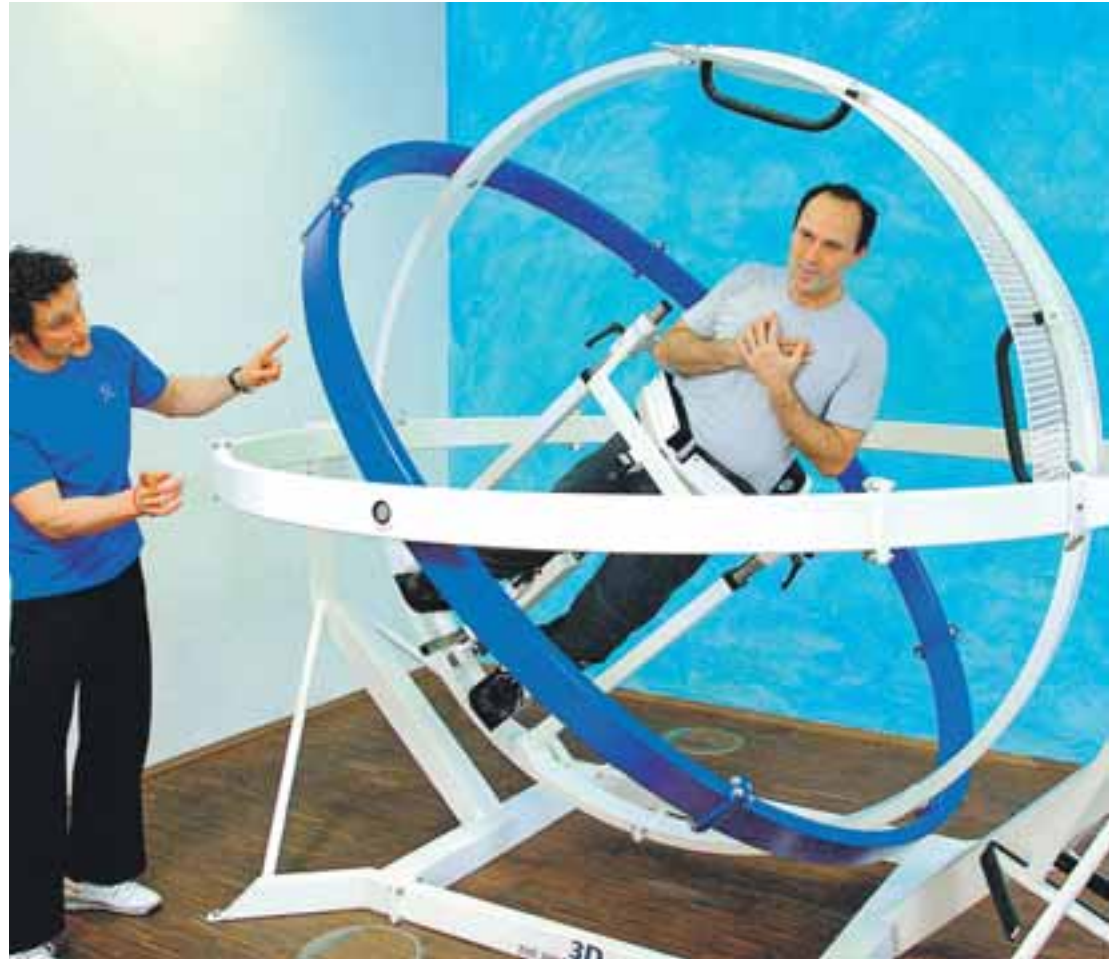
Medical-Wellness-Einrichtungen nutzen beispielsweise das Space Curl, um die Rückenmuskulatur der Gäste zu stärken und die Körperhaltung zu verbessern. TÜV RHEINLAND

Wellness-Trainer stellen in der eigenen Praxis, in Wellness- und Kureinrichtungen oder Hotels Übungs- und Wellnessprogramme zusammen, führen Behandlungen durch und beraten in allen Fragen rund um Wellness und Gesundheit. Der Wellness-Manager