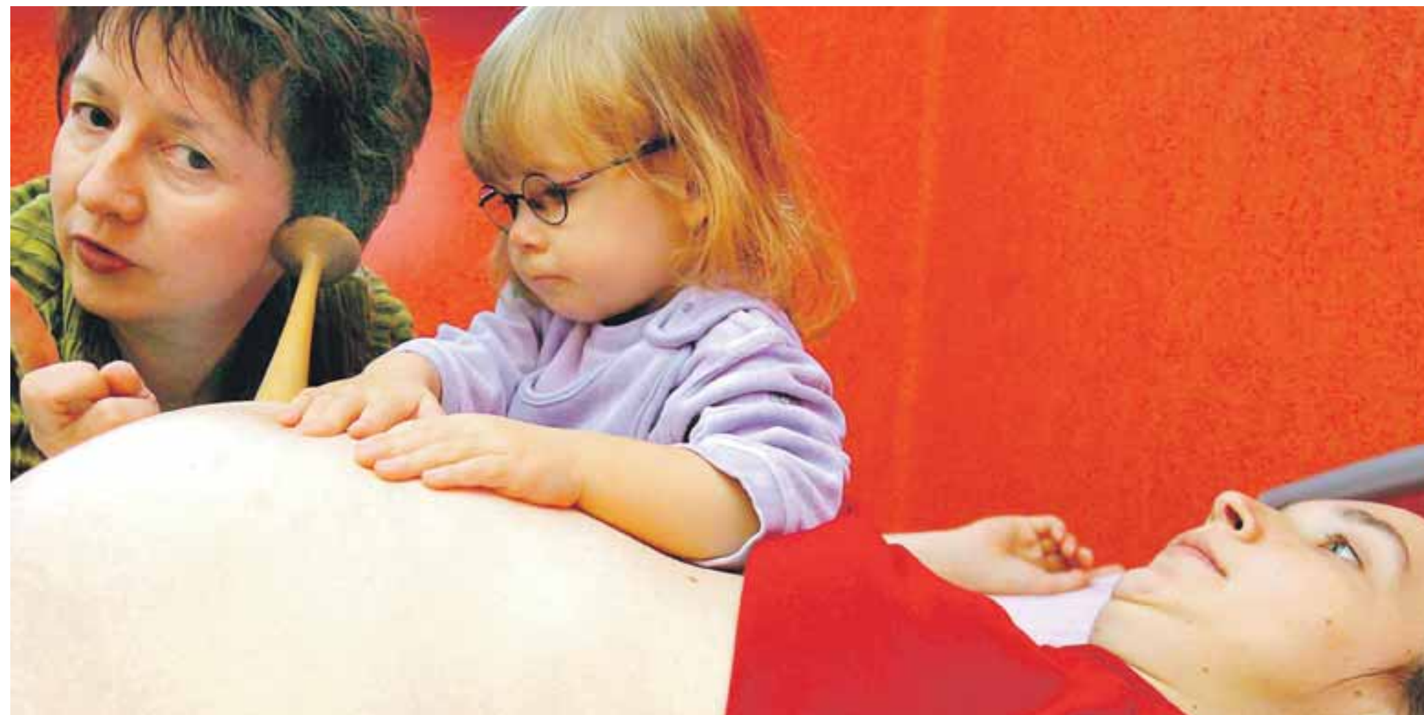
Die Hebammen bilden eine Brücke zwischen Eltern und sozialen und medizinischen

„Mit ihren Komm- und Bringangeboten erreichen Familienhebammen gerade solche Familien, die von sich aus keine Hilfe in Anspruch nehmen würden. Sie bilden eine wichtige Brücke zwischen Eltern und sozialen und medizinischen Institutionen, leisten wertvolle Arbeit zur Stärkung der Familie und zum Schutz der Kinder und haben sich als ein Baustein in der Prävention bewährt“, betont Müller-Klepper. Hebammen hätten einen Vertrauensbonus, der es ermögliche, Zugang in Familien zu bekommen, die öffentlichen Einrichtungen skeptisch gegenüber ständen. Gemeinsam mit dem hessischen