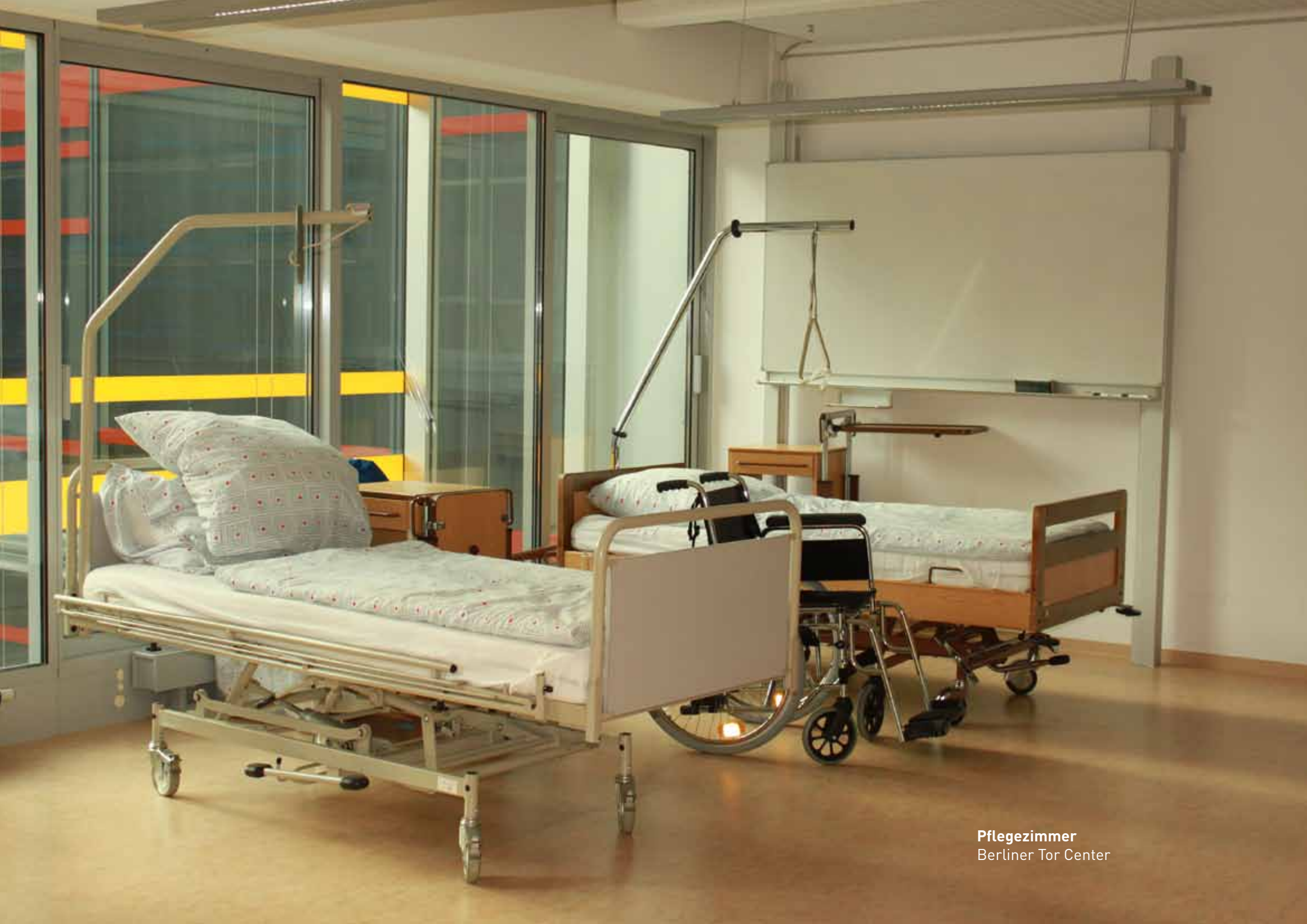
Pflegezimmer Berliner Tor Center