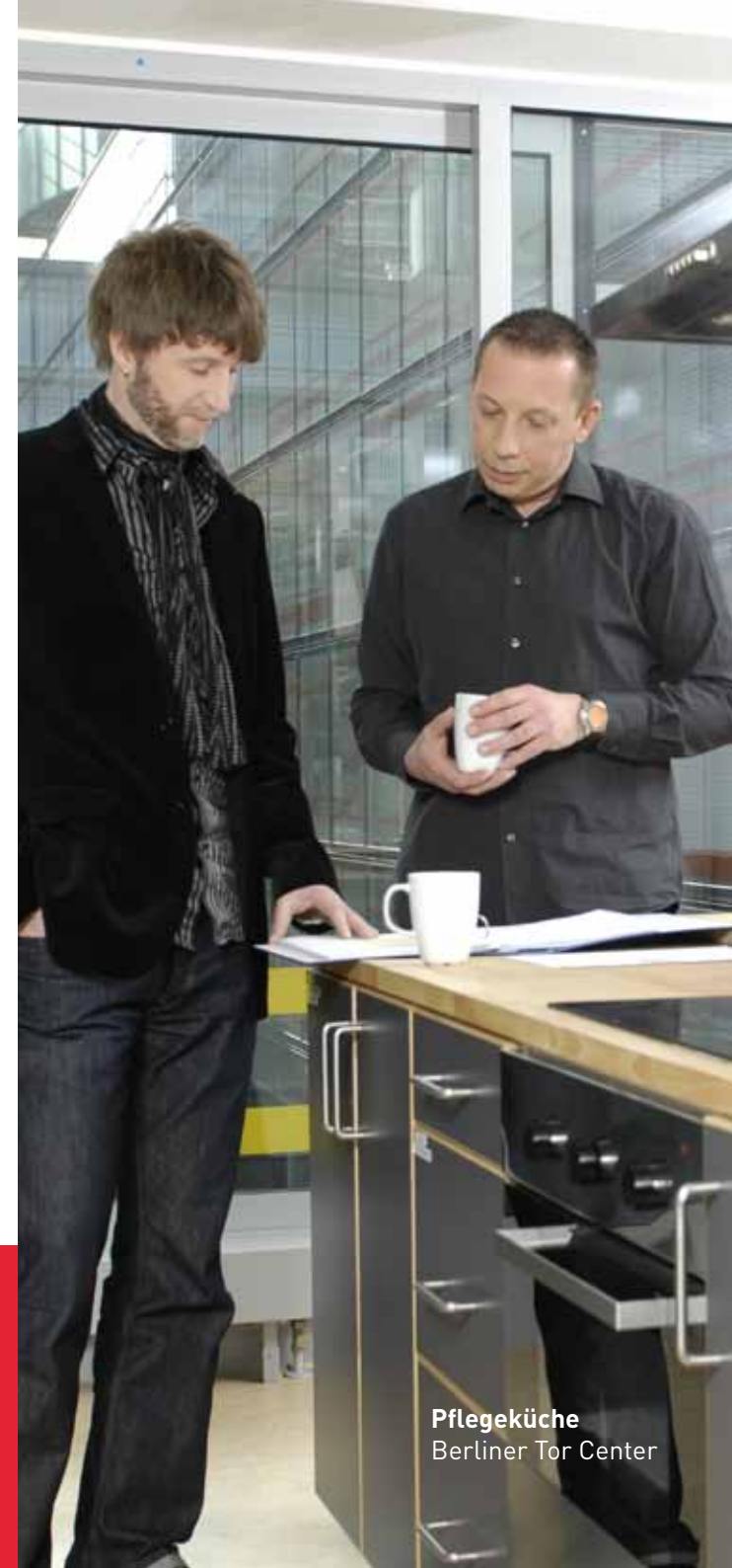
Pflegerküche Berliner Tor Center

Seminarart: 2 Jahre > berufsbegleitend 4 Tage pro Monat (Do.-So.) Nur in Hamburg möglich!