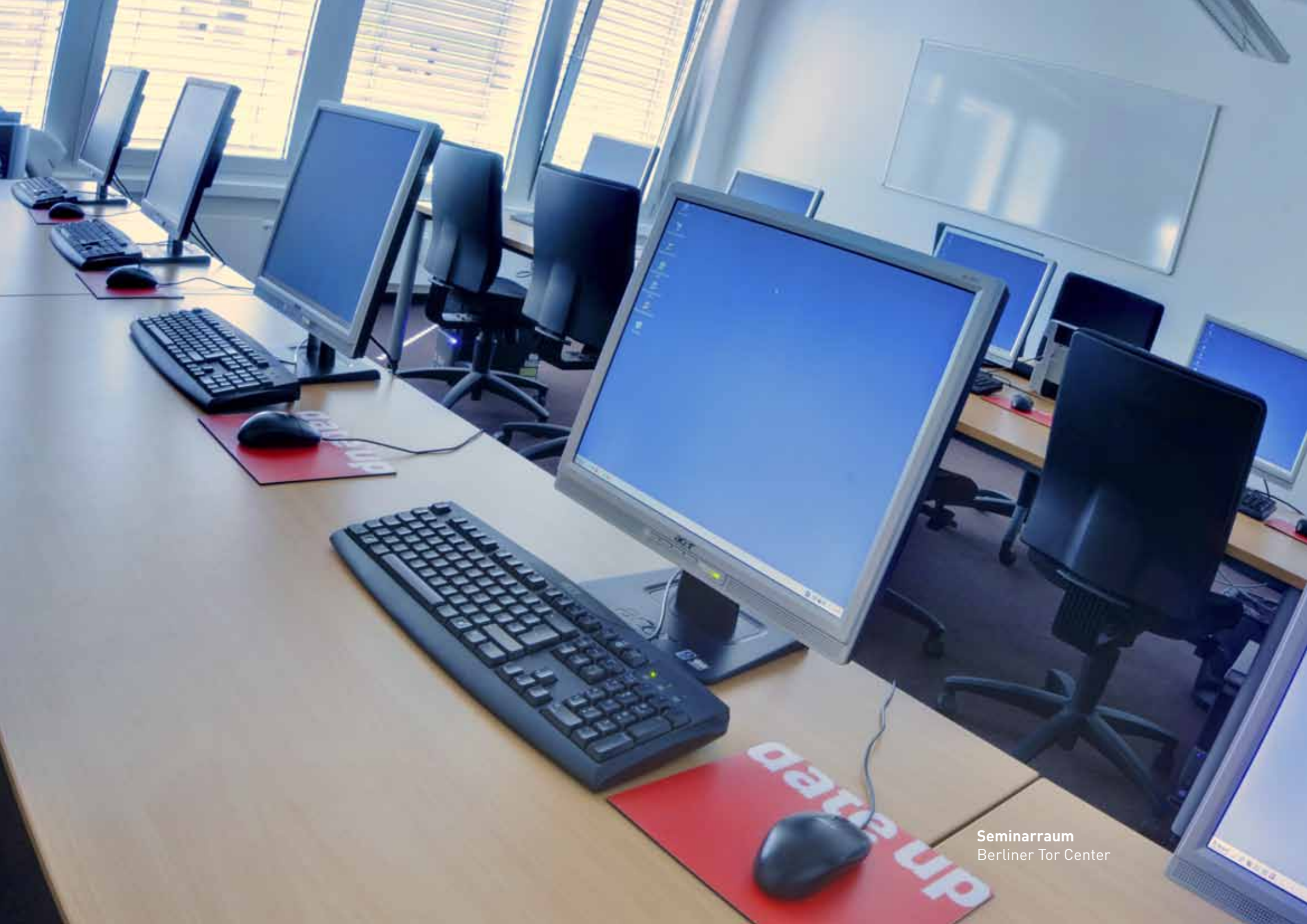
Seminarraum Berliner Tor Center